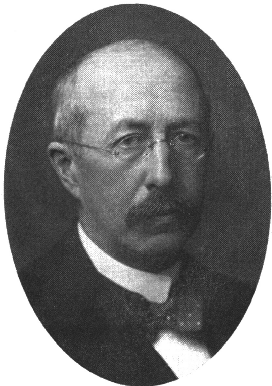
Martin P:son Nilsson ca 1930.