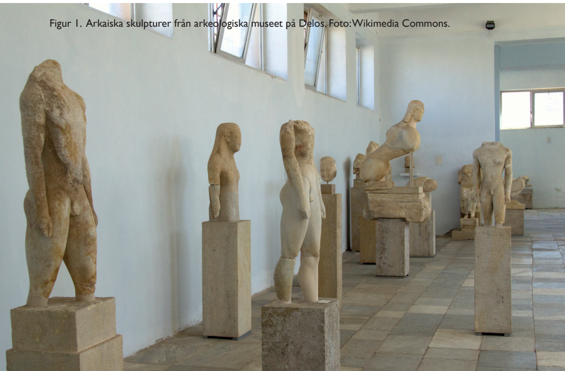
Figur 1. Arkaiska skulpturer från arkeologiska museet på Delos.

Förbluffande lite sägs om hur tingen får sin mening i offentliga debatter. Arkeologer talar ibland om stumma ting. De flesta är